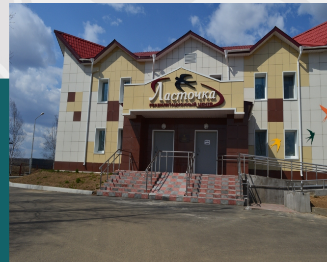
Адаптация объектов соцобслуживания

1 объекте размещения органов исполнительной власти